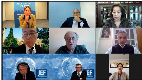
オンライン会議の様子（セッション3）