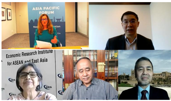
オンライン会議の様子（セッション1）