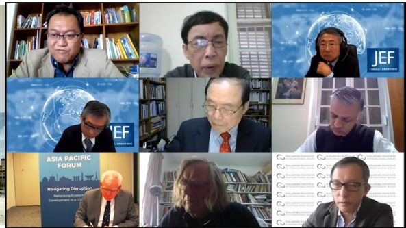
オンライン会議の様子（セッション2）