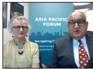
開会挨拶 NZIIA会長 Satyanand氏（右）