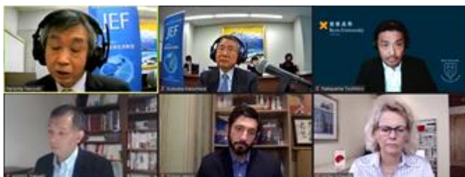
会議全体の様子（オンライン上）